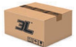
120 pares caja 120 pairs box