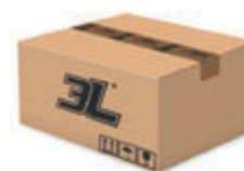
100 pares caja 100 pairs box