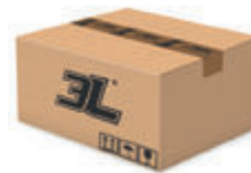
96 pares caja 96 pairs box